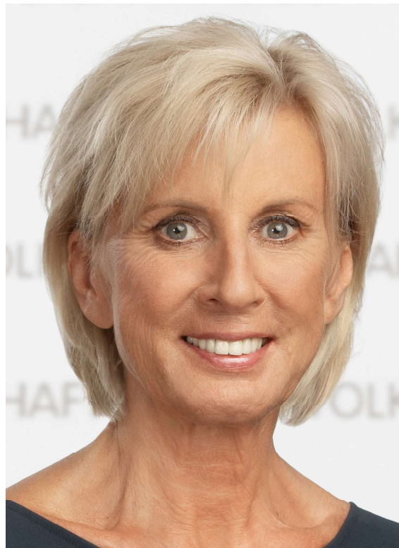
Gaby Schwarz Volksanwältin