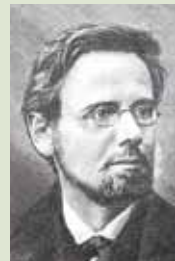
Auf den Spuren von P. Rosegger