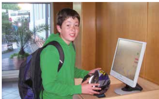
Bikelineanmeldung mit Helmchip

Jeder Teilnehmer der Bike- line ist ein Gewinner. Jeder leistet einen Betrag zu seiner persönlichen Gesundheit und zum Umweltschutz und zu- sätzlich ist jeder ein Vorbild, nicht nur für seine Mitschü- ler/innen, sondern auch für die Erwachsenen.