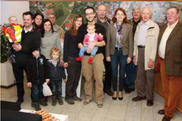
Amtsstunden einmal anders.