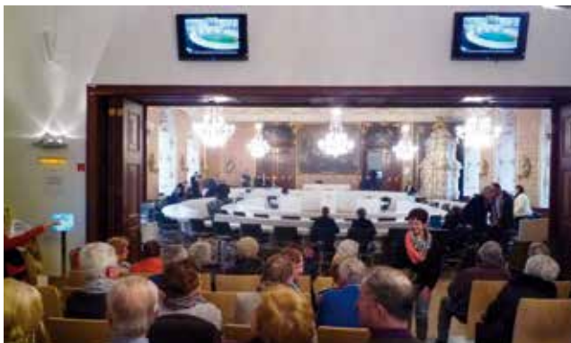
Aufmerksam und kritisch verfolgen die Hitzendorfer Senioren die Landtagssitzung.

Nach dem hochinteressanten Besuch der Landtagssitzung und einem guten Mittagessen besichtigen wir das Münzkabinett und das Archäologiemuseum am Areal von Schloss Eggenberg. Das wertvollste Objekt der Sammlung ist der Kultwagen von Strettweg mit einem Versicherungswert von 50 Millionen Euro.