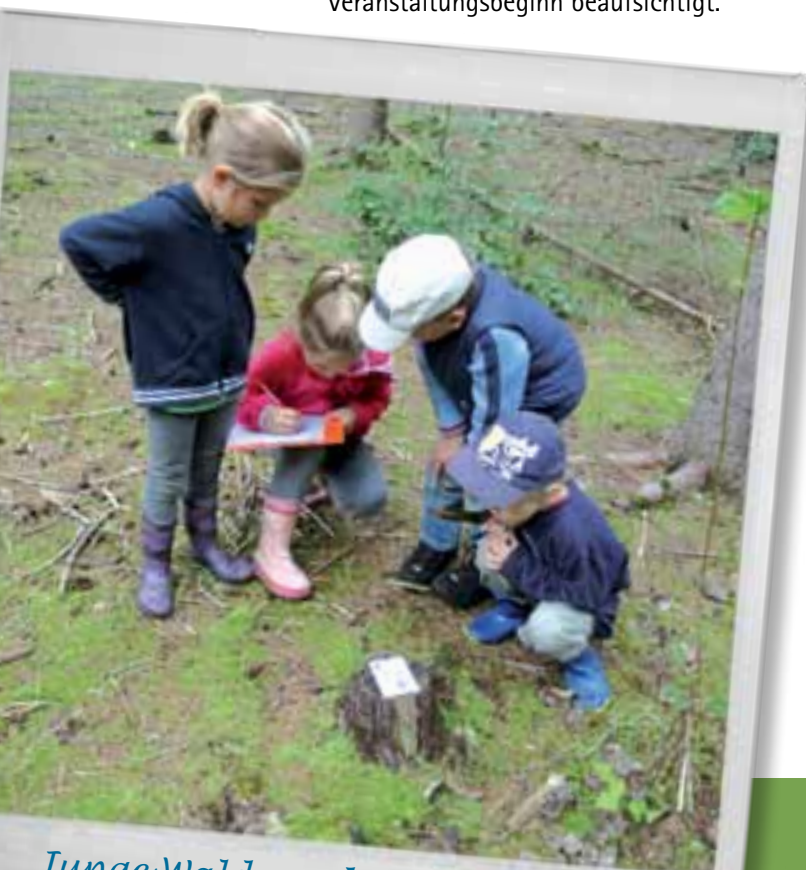
Junge Wald- und Wiesendetektive bei der Arbeit.