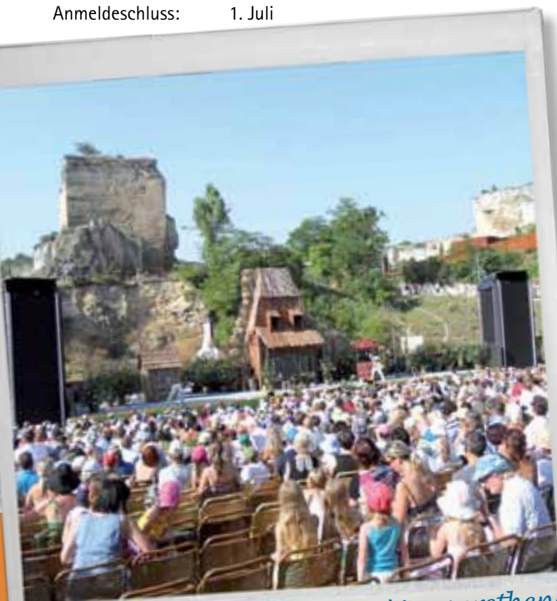
Die Bühne in St. Margarethen