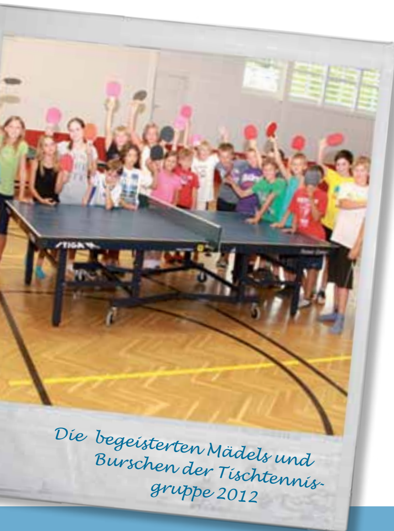
Die begeisterten Mädels und Burschen der Tischtennis- gruppe 2012